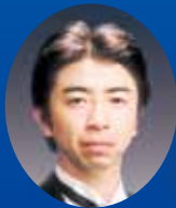
バリトン 竹永久男