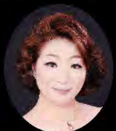
メゾソプラノ 淀 和恵