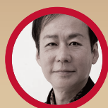
水野利彦 箏曲演奏家