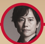
藤原道山 尺八演奏家