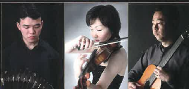
啼 鵬 (バンドネオン) ていぼう